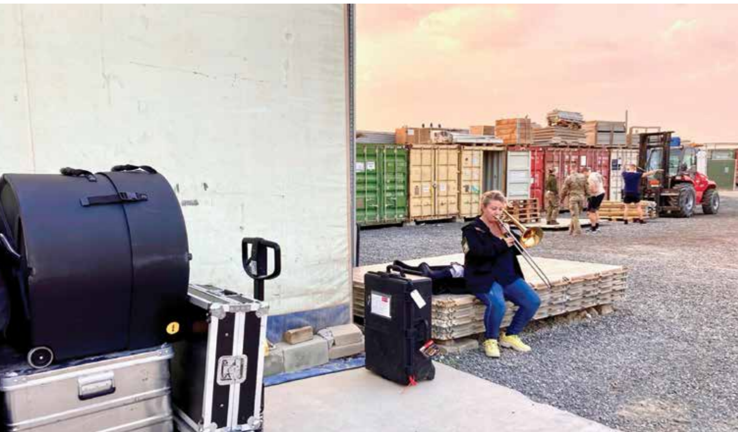
Dagens øvelokale, når man er på tur