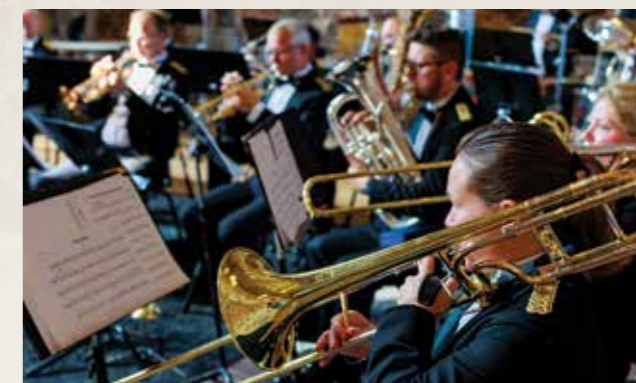
SMUK på Koldinghus